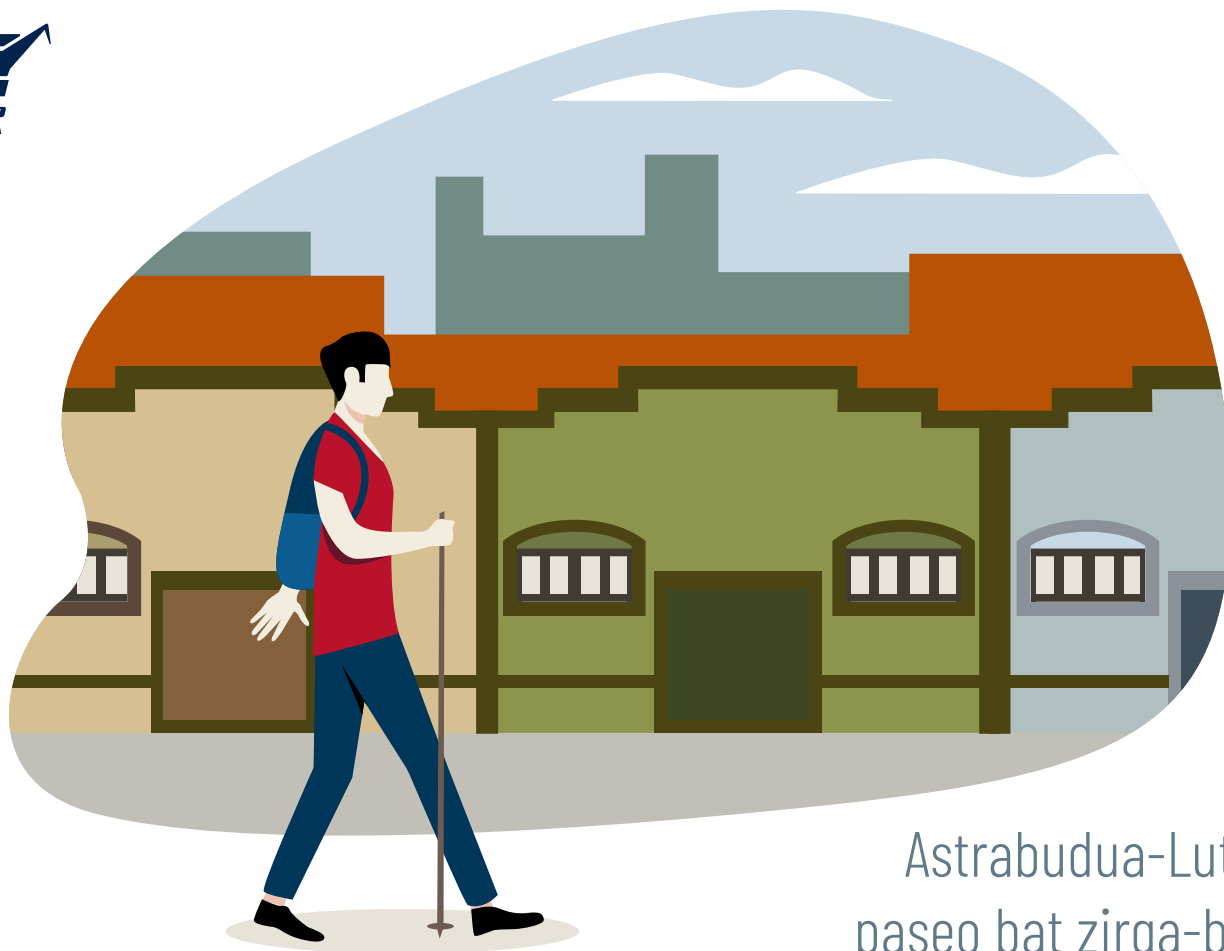
Astrabudua-Lutxana, paseo bat zirga-bidean